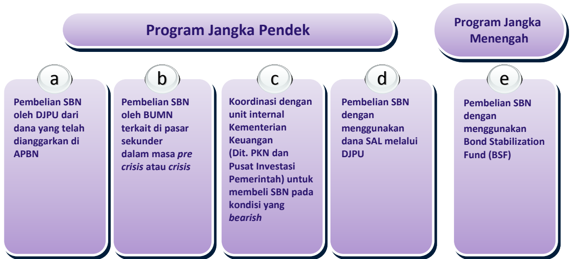
Diagram 1, Bond Stabilization Framework

Bond Stabilization Framework (BSF) adalah langkah-langkah strategis yang dipersiapkan dalam mengantisipasi terjadinya gejala atau krisis pasar SBN, termasuk yang disebabkan oleh large and sudden reversal . BSF terdiri dari program jangka pendek dan program jangka menengah. Program jangka pendek yang dimaksudkan adalah program yang telah dapat dilaksanakan saat ini, sedangkan program jangka menengah diperkirakan baru dapat diimplementasikan dalam periode 2-5 tahun ke depan.